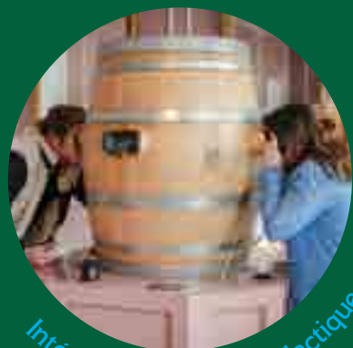
Interactif • Ludique • Didactique