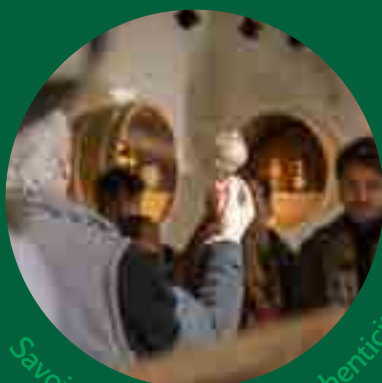
Savoir-faire • Identité • Authenticité