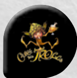
Préservatif Cuvée des Trolls