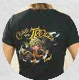
T-shirt Cuvée des Trolls