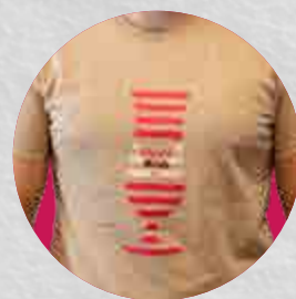
T-shirt Fram' Bush