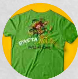
T-shirt Rasta Trolls