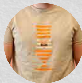
T-shirt Pêche Mel' Bush