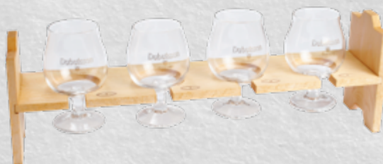
Rafale 4 galopins Dubuission