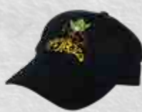
Casquette Cuvée des Trolls