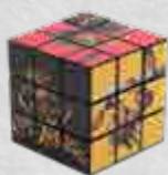
Rubik's Cube Cuvée des Trolls